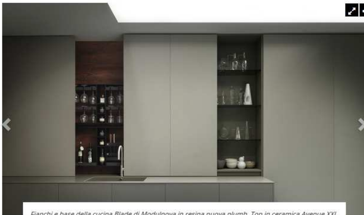
Fianchi e base della cucina Blade di Modulnova in resina nuova plumb. Top in ceramica Avenue XXL nlumb