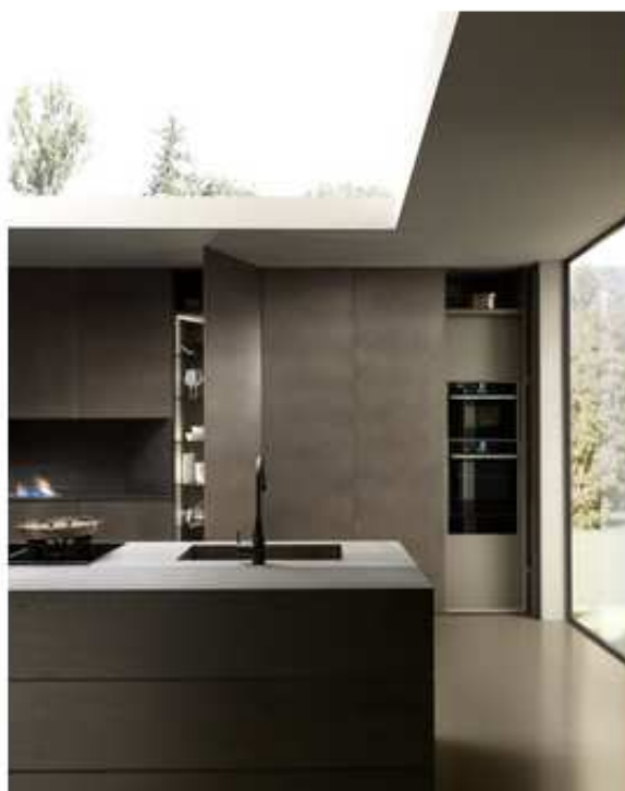
Grandi ante terra-soffitto della cucina Blade di Modulnova in laccato epossidico, senza zoccoli e maniglie.

Un importante ampliamento nella gamma delle finiture , con l'introduzione di una serie di nuovi materiali metallici – tra i quali l' ottone invecchiato e un effetto lamiera molto "underground" – completa la proposta di Blade che si rivolge a un pubblico raffinato, che ama lo stile unico e inconfondibile di Modulnova.