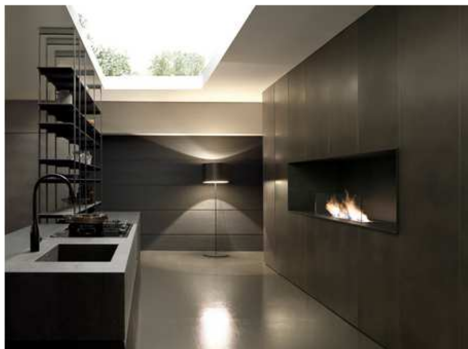
Veduta del piano cucina Blade di Modulnova e parete con caminetto in gres pietra Savoia antracite.