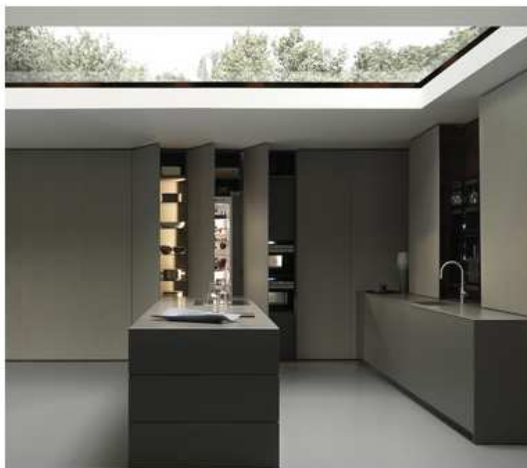
Nel sistema cucina Blade di Modulnova i mobili si integrano perfettamente nello spazio abitativo senza inquinare i volumi e senza rinunciare ovviamente alla funzionalità.