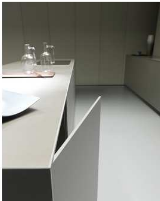
Maniglie della cucina Blade di Modulnova con sistema premi-apri.