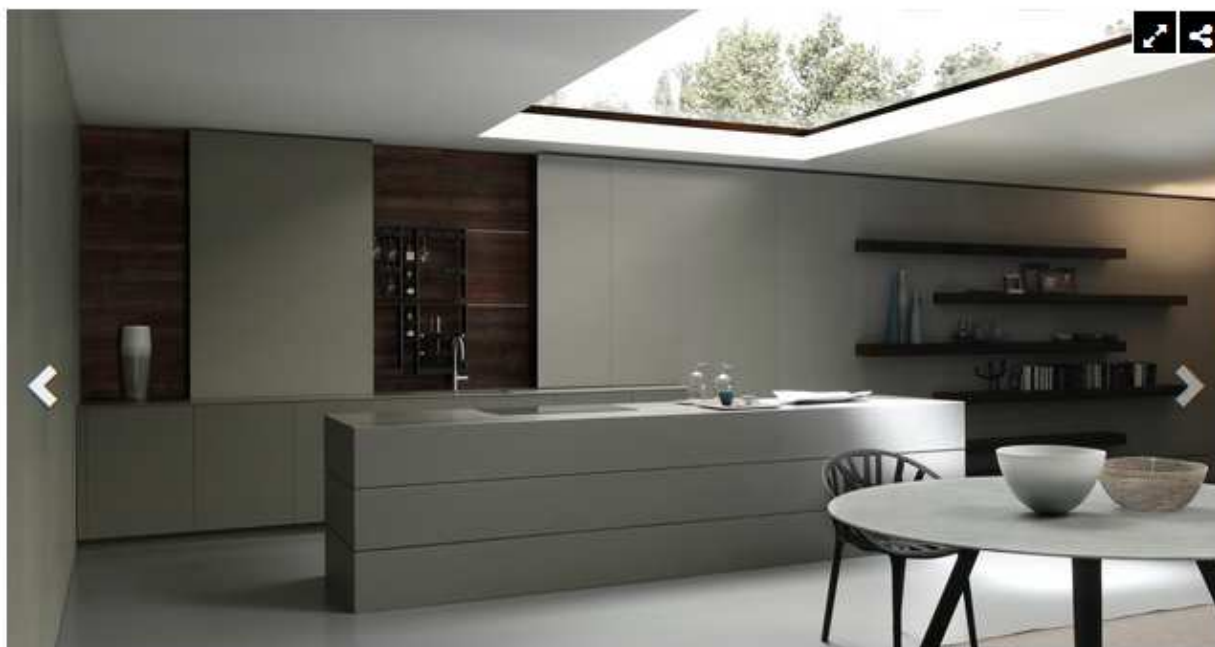
Veduta cucina Blade di Modulnova e soggiorno con tavolo Iron in marmo di Carrara.