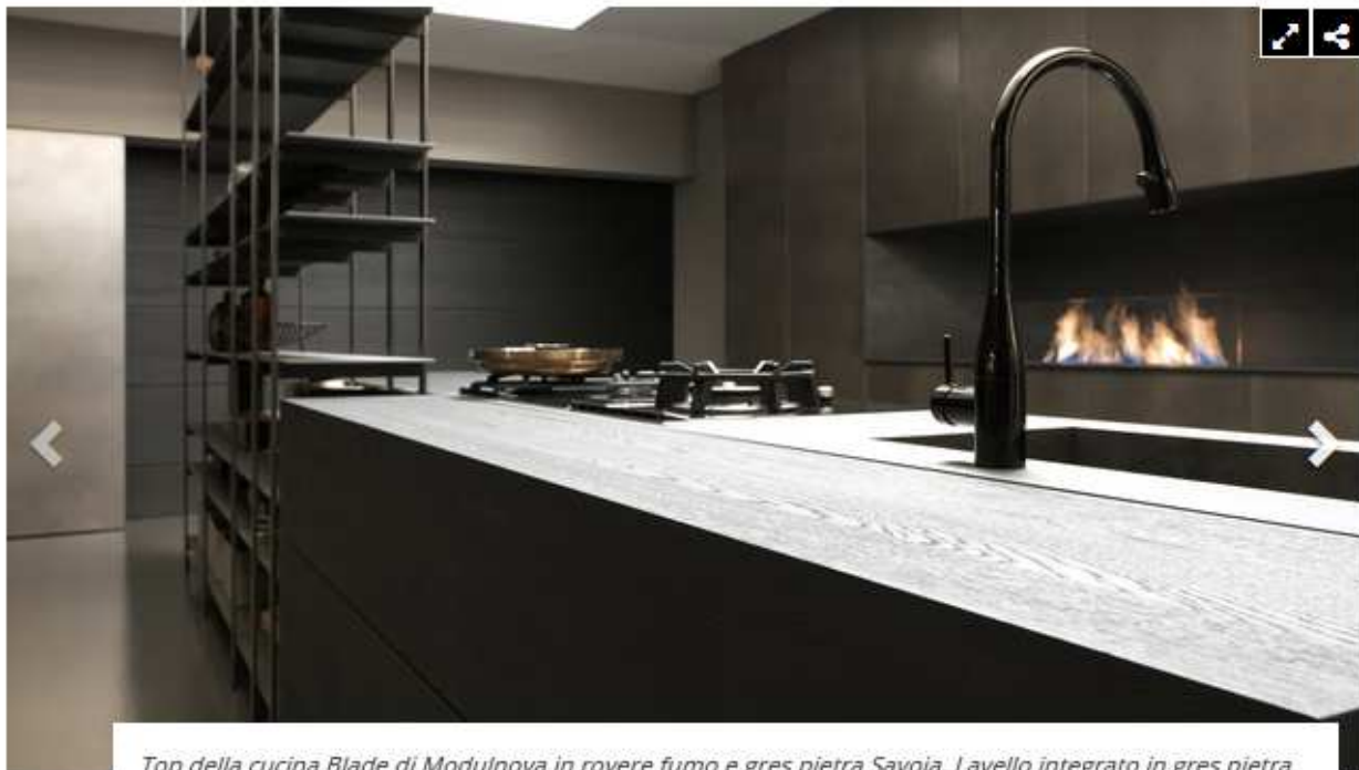
Top della cucina Blade di Modulnova in rovere fumo e gres pietra Savoia. Lavello integrato in gres pietra Savoia.